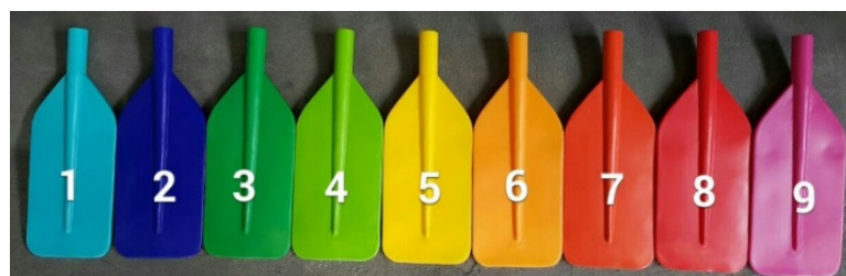
สีไม้พายแบบล่องแก่ง