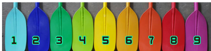
สีไม้พายแบบทะเล แม่น้ำ